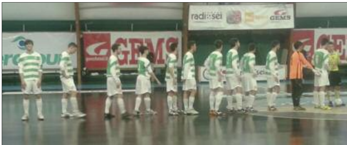
Sopra: la Juniores della Roma Torino in occasione della partita con la Lazio. Sotto: i Giovanissimi schierati prima dell'inizio del match pareggiato per 4-4 con la Roma 3Z